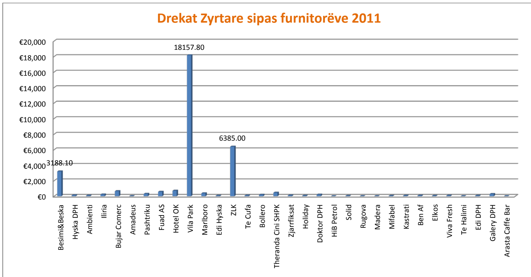
Grafikoni nr.1: Shpenzimet për dreka zyrtare sipas furnitorëve