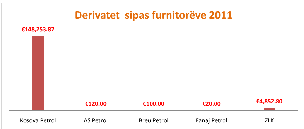
Grafikoni nr.3: Furnizimi me karburanteve sipas operatorëve ekonomik 2011

Për karburante për vetura Komuna e Prizrenit për vitin 2011 ka shpenzuar 153.346,67 euro, kurse për mirëmbajtjen dhe riparimin e automjeteve janë shpenzuar 27.915,79 euro. Pjesa më e madhe e karburanteve janë blerë nga Kosova Petrol (grafikoni nr.3).