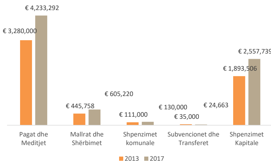
FIGURA NR.1: TRENDET BUXHETORE 2010-2017

Në katër vitet e fundit, kategoria e investimeve kapitale ka shënuar rritje nga 1.9 milion euro që ishte më 2013, në 2.6 milion euro më 2017. Kurse kategoria e pagave dhe mëditjeve po ashtu është rritur nga 3.3 milion euro më 2013 në 4.2 milion euro më 2017.